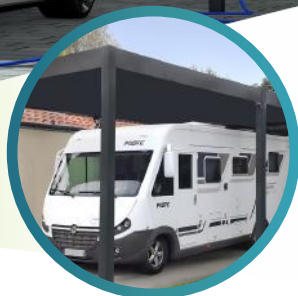
CAMPING CAR Hauteur max 3,5m