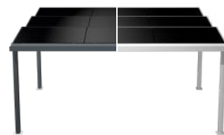
Anthracite mat RAL 7016